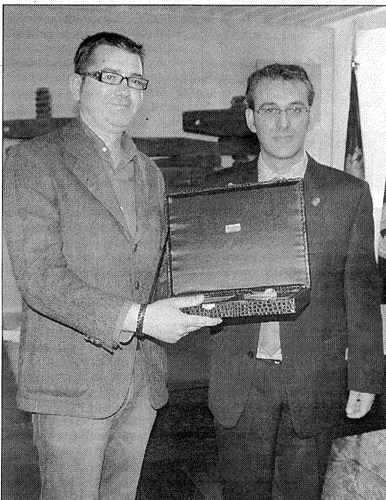
El propietario de la almazara recibió el premio

La almazara Aceites Baos, S.A., es una empresa familiar fundada en 1906 que desde sus orígenes